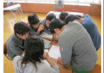
チャレンジプランでも対話やグループでの話し合いを多く取り入れています。