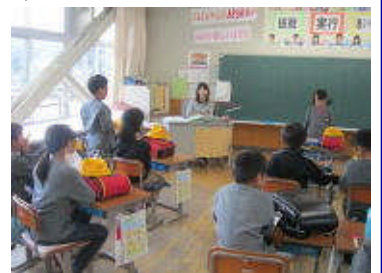
終わりの会で、がんばったこと友だちのよい言動などについて発表し合っています。

調査結果はあくまでも全体的な傾向です。大事なことは、子どもたち一人一人を学習、生活両面からしっかり把握、理解し、個々に対応したきめ細かな指導をすることだ考え取り組んでいます。全体的に表現しようとする意欲や聞く態度が向上しています。また、2学期の生活アンケートの結果から、自尊感情も自信も増したことがうかがえます。